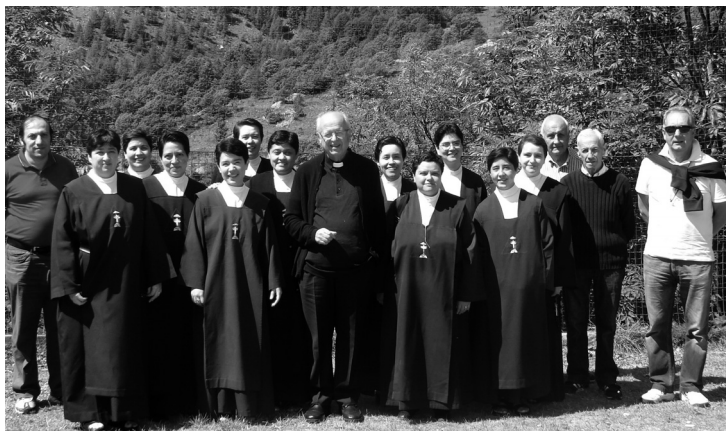
Il gruppo delle suore in esercizi spirituali a Chiappera